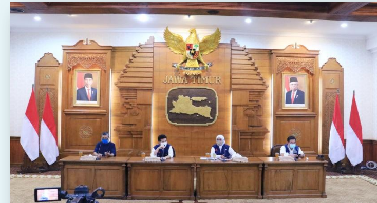
Rilis Berita dan Hubungan Media (Pers) Terkait Kebijakan Penanggulangan Covid-19