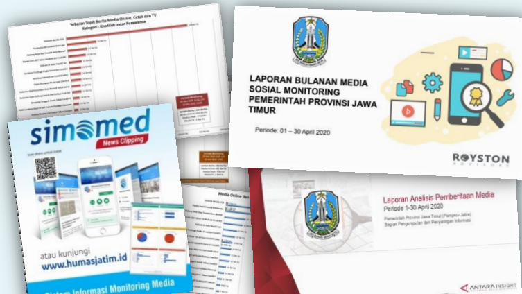
Laporan Khusus Analisis Berita dan Isu Publik Terkait Kebijakan Penanggulangan Covid-19