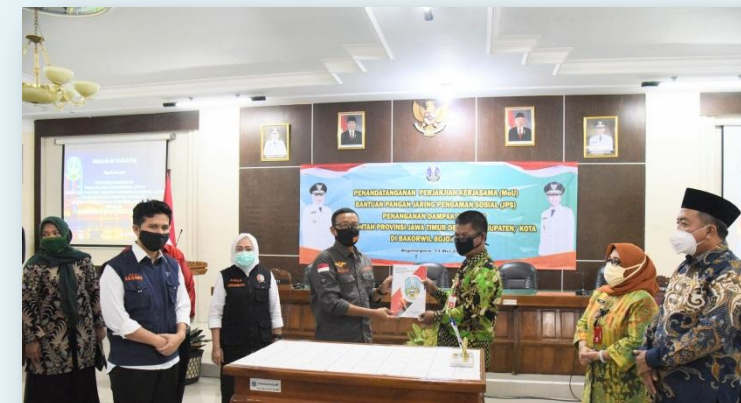
Percepatan Penyusunan Dokumen Kerjasama Khususnya Terkait Kebijakan Penanggulangan Covid-19