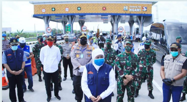
Pelayanan Keprotokolan Kegiatan Pimpinan Dalam Penanggulangan dan Pemulihan Dampak Covid-19